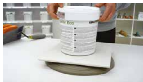
Sostiene la piastrella