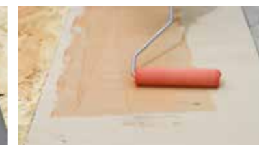
PVC Keragrip Eco