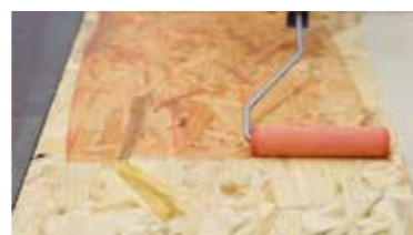
LEGNO Keragrip Eco