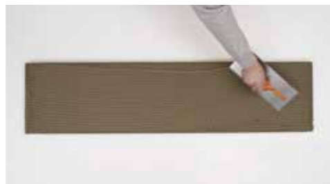
Stesura H40 ®