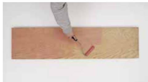
Preparazione Keragrip Eco