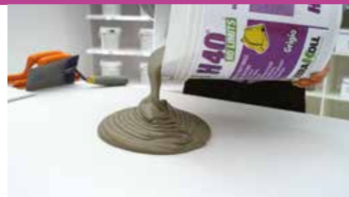
Impasto Tixo e Fluido

H40 ® No Limits ® è tixotropico in tutti gli spessori, scorrevole e leggero. Anche a parete lavori senza fatica e senza scivolamento della piastrella.