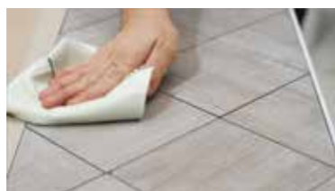
CERAMICA pulizia e asciugatura